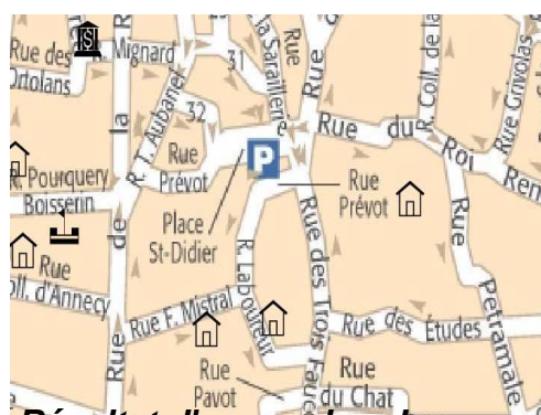
Résultat d'une recherche...